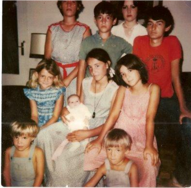
Estas son mis diez Medallas que ya ni cabían en la foto.