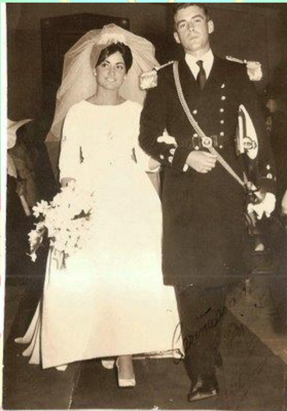
El 5 de agosto de 1960 me casé con un Infante de Marina. Nunca pensé que viviría el resto de mis días con un Boina Verde.