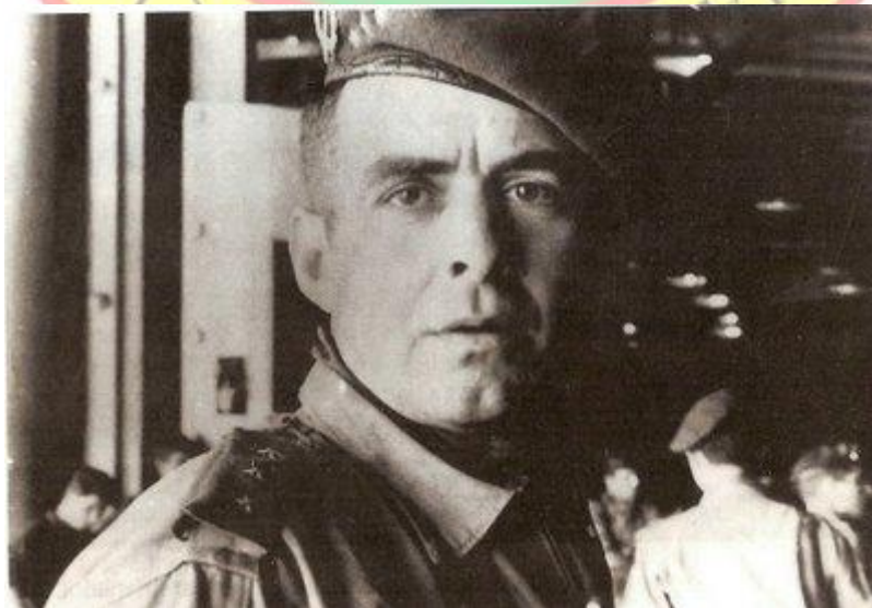
Esta foto ha dado la vuelta al mundo en ochenta revistas del tema militar.

Como los hados del destino debían tener ya previsto, perdí ese momento estelar del que meses más tarde sería el fundador de la Unidad de Operaciones Especiales de la Infantería de Marina. Eso sí, el salto fue de película, según me contaron. Clavadito en el punto fijo y de pie, como él se había programado así mismo. Precisión que siguió fomentando a lo largo de los veintiséis años que estuvo revalidando esa especialidad de paracaidismo. ¿Suponía algo que la columna sufriese consecuencias negativas? ¿Suponía algo que, pasados los años tuviera que someterse a una durísima operación de una fractura en el pie nunca antes detectada? Nada, como en otras muchas ocasiones, nada era comparable a la consecución de sus objetivos. Y la secuencia del salto, como si el episodio de mi pequeño no hubiera sucedido, llegué a contemplarla a la perfección, a través de su intenso relato, pleno de sensaciones, precisión, sentimientos y temores... Porque sí, la emoción de un salto en paracaídas no sería completa si no llevase también aparejada esa otra del ineludible temor.