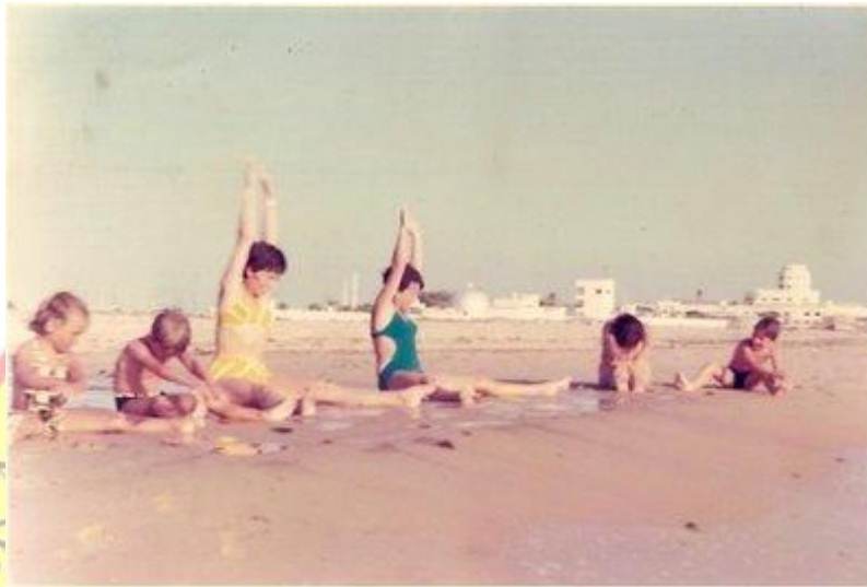
Una de las pequeñas muestras que aún conservo

Al primer baño se sucedían nuestras marchas a lo largo de la playa hasta Puerta Tierra, casi en la unión con el mismo Cádiz, para realizar todos allí las tablas de gimnasia, a las que se unían tíos, amigos y abuela que todos los veranos pasaban algunos días con nosotros.