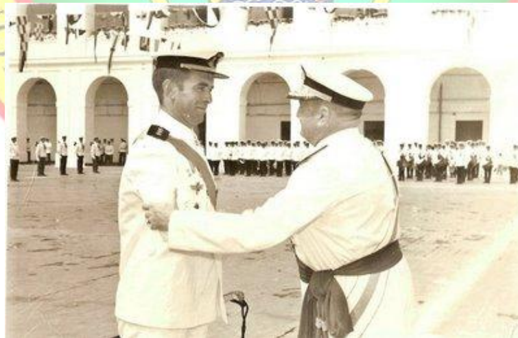
El 4 de septiembre de 1968, el, ya General Galinsoga, le impone la Cruz al Mérito Naval de Primera Clase.

Puede que alguno, de los que me lea, piense que en la elaboración de este post ha tenido que ayudarme el propio fundador; error que no quiero que nadie cometa ya que estos recuerdos vividos a presión, con fechas incluidas, soy yo la que, desde que supe que podría competir con cualquier mujer del mundo que se interpusiera entre nosotros, pero nunca lo lograría con la U.O.E, los ha ido archivando con sumo cuidado y cariño para transmitirlos a mis descendientes, sin pensar por lo más remoto que un día serían publicados en este invento tan singular y entrañable de un blog.