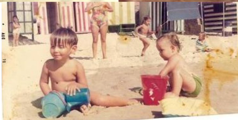
Parece que fue ayer y vuelvo a contemplar aquella fina arena gaditana en la que gustosamente se rebozaban mis críos.